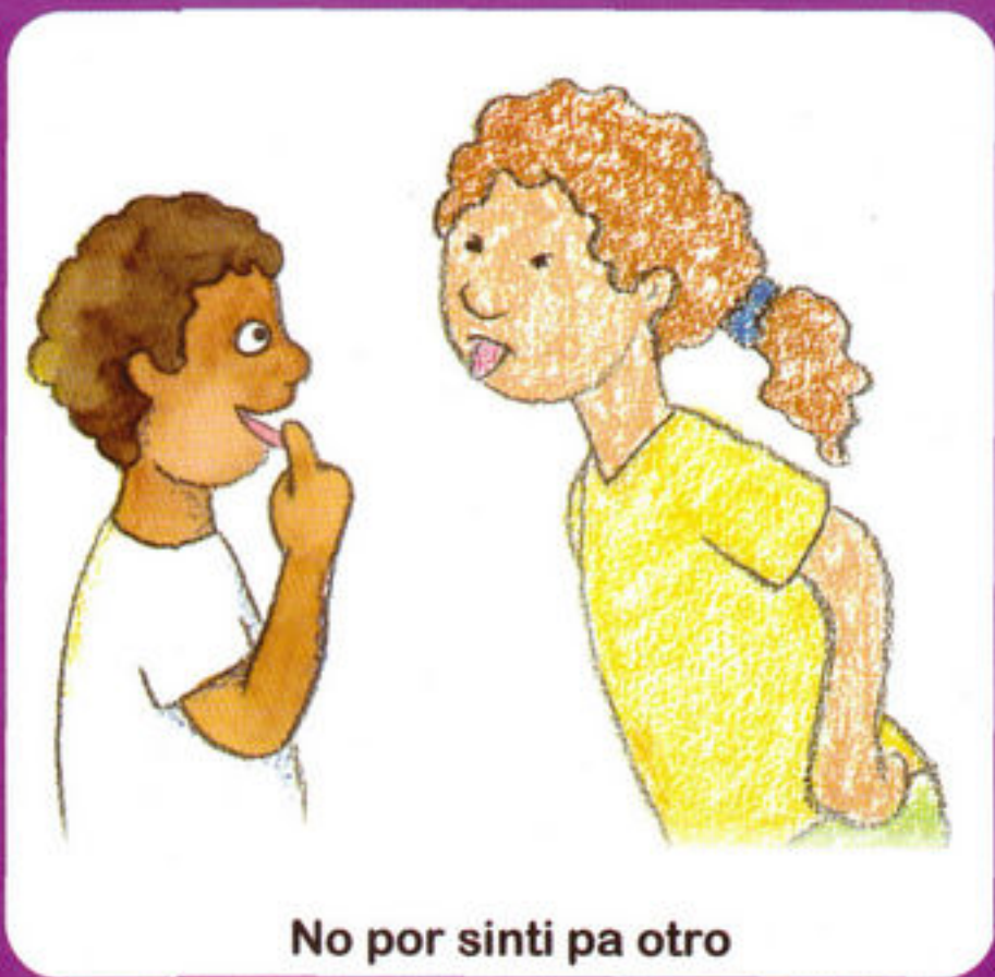
No por sinti pa otro